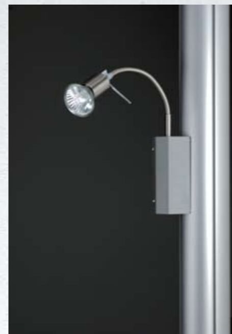
Spot aggiuntivo da colonna [optional] Extra spot light [optional]