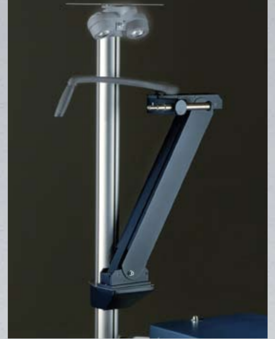
Modulo per forottero con movimento manuale [optional] Manual phoropter arm module [optional]