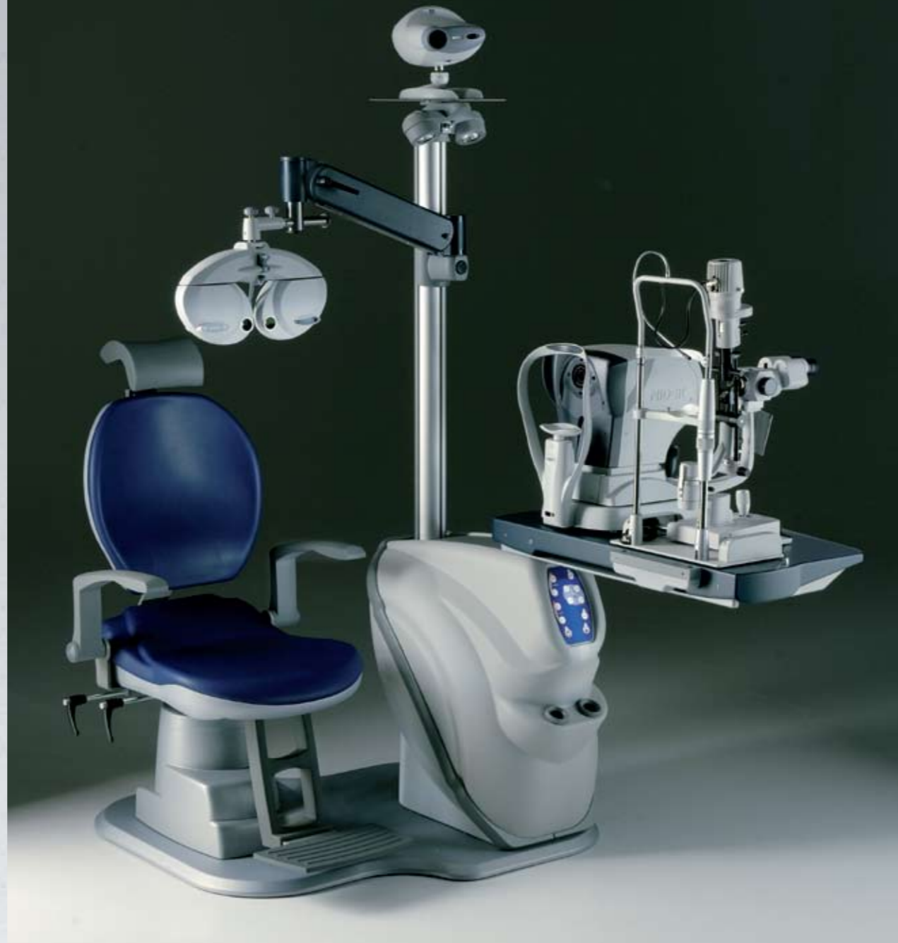
Riunito con strumenti Unit with instruments