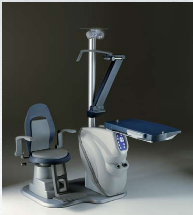
Riunito con piano traslabile per 2 strumenti con sistema di bloccaggio in ogni posizione Unit with sliding instruments table with lock system in all positions