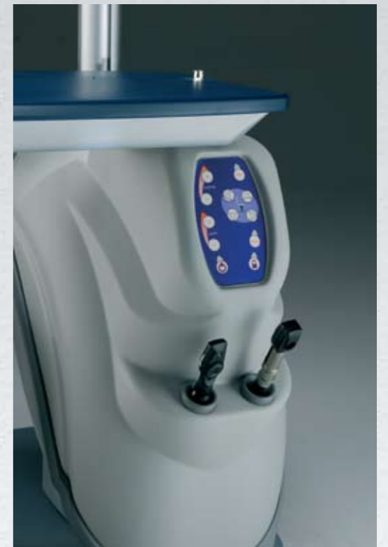
Pannello comandi digitale e supporto strumenti a mano Digital control panel and hand instruments support