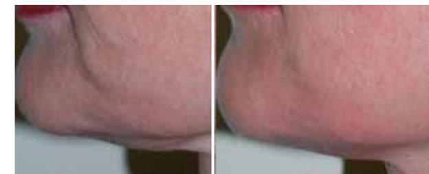
Particolare della piega sottocommissurale (paziente di 60 anni)