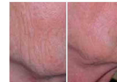
Particolare del compattamento della trama cutanea (paziente di 81 anni)