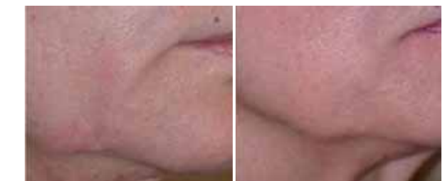
Particolare della piega sottocommissurale e del bordo mandibolare (paziente di 65 anni)