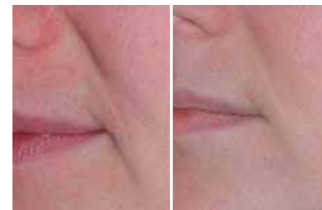
Particolare del solco nasolabiale e sottocommissurale (paziente di 31 anni)