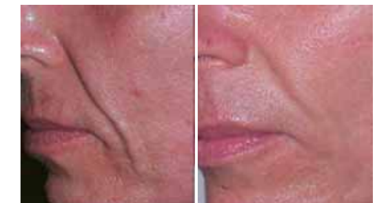
Particolare della piega nasolabiale (paziente di 52 anni)